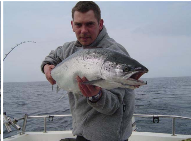
Noch einmal aus anderer Perspektive